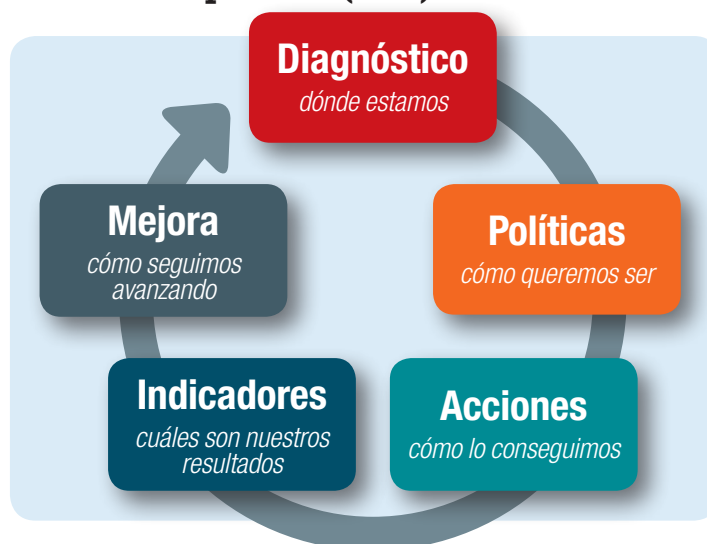
Gráfico 2 Metodología de avance en Responsabilidad Social Corporativa (RSC)

en relación con el tiempo de respuesta. Por otra parte, el 94 % de la plantilla de AENOR está comprometido con la organización, sus objetivos y metas. La apuesta de AENOR por un empleo de calidad –a cierre de 2015 el 99,4 % de los contratos eran indefinidos– la impartición de acciones de formación en las que participaron el 88 % de la plantilla o la definición de 45 medidas para la conciliación de la vida personal y profesional son algunos factores que influyen en este compromiso de la plantilla.