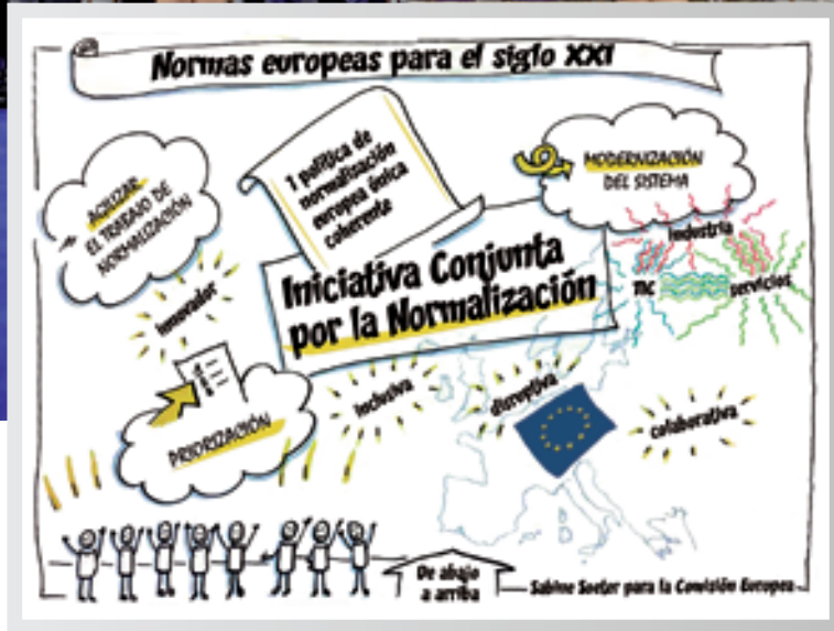
El 13 de junio se celebró en Ámsterdam un acto de apoyo a la "Iniciativa Conjunta por la Normalización". El encuentro estuvo presidido por la Comisaria Europea de Mercado Interior, Industria, Emprendimiento y PYMES, Elzbieta Bienkowska, y por el Primer Ministro de Países Bajos, Mark Rutte, contando con la participación de AENOR.

Para respaldar la nueva visión de la normalización y en línea con la Iniciativa Conjunta por la Normalización , la Comisión Europea también propone en su Comunicación que se inicie un diálogo interinstitucional con el Parlamento Europeo, el Consejo, el Comité Económico y Social Europeo, y el Comité de las Regiones sobre la aplicación de la política de normalización en la UE, así como la contribución de las normas europeas a las políticas de la UE en general y a la creación de empleo, competitividad y crecimiento, en particular.